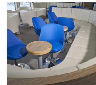
Miejsca dla pasażerów